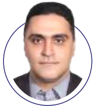
| حسن باقری |